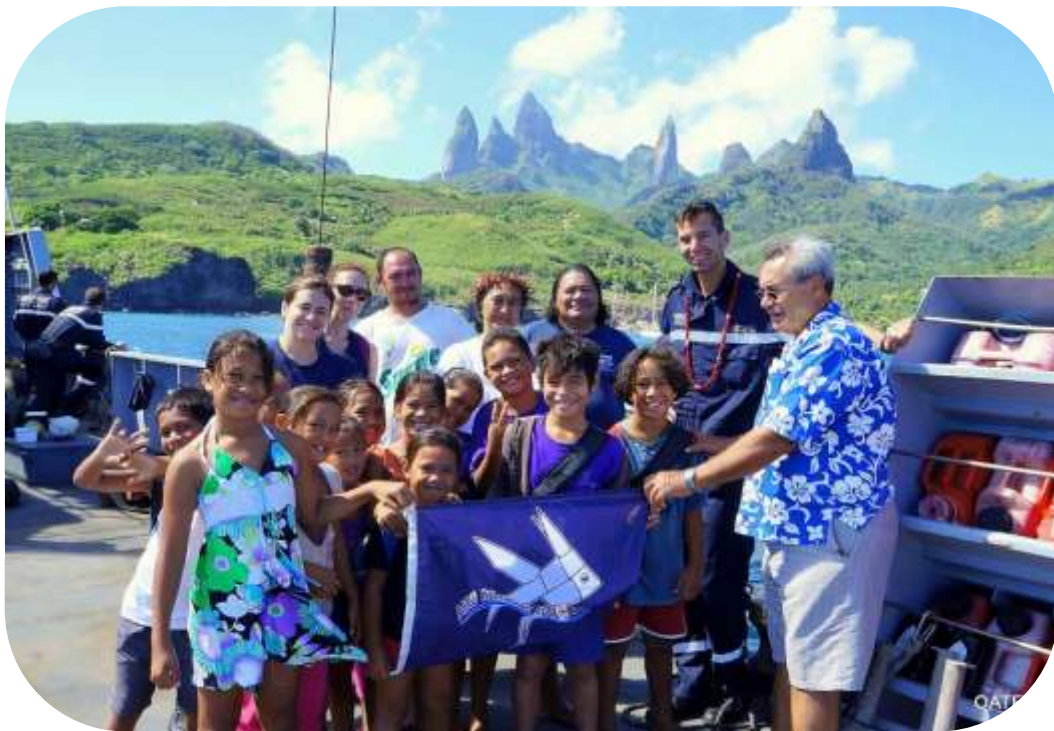
Figure 2 Remise du drapeau aire marine éducative à l'école de Hakahetau en présence du commandant de l'Arango, du Président et du Vice Président de Motu Haka, de représentants de l'Agence des aires marines protégées et de la commune de Ua Pou

Contact : sophie-dorothee.duron@aires-marines.fr