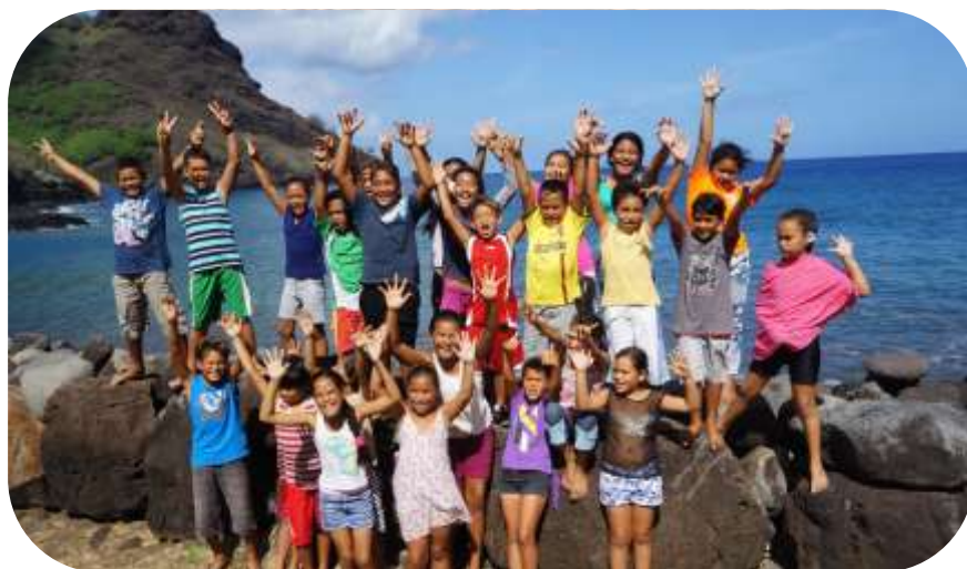
Figure 1 Elèves gestionnaire de l'AME de Tahuata

La direction de l'enseignement primaire (DGEE), La circonscription de l'éducation des îles Marquises, La fédération culturelle et environnementale des Marquises MOTU HAKA, L'Agence des aires marines protégées, La direction des ressources marines (DRMM), La direction de l'environnement (DIREN), La délégation à la recherche, La délégation à la recherche et aux nouvelles technologies (DRRT) Les 7 écoles partenaires du réseau Pukatai, Les référents du patrimoine des marquises (MOTU HAKA) Le chef de projet Marquises-UNESCO, La responsable locale de l'IFRECOR, La Marine Nationale, La fédération des associations environnementales de Polynésie française (FAPE) L'association Te Mana O Te Moana La société CREOCEAN L'association 2D attitude La compagnie maritime ARANUI